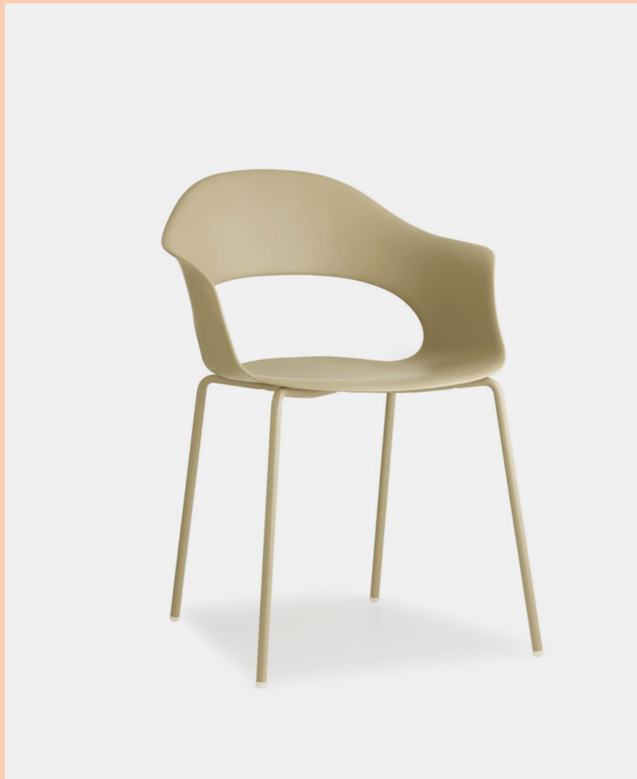
Armchair Poltrona Lady B, art. 2696

Technopolymer seat. Scocca in tecnopolimero.