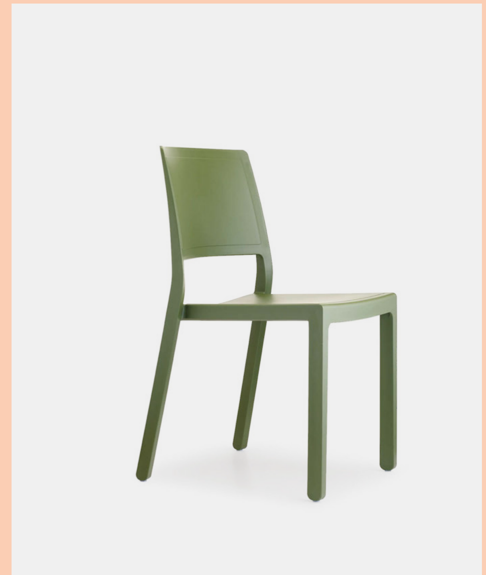
Stackable chair Sedia impilabile Kate, art. 2341