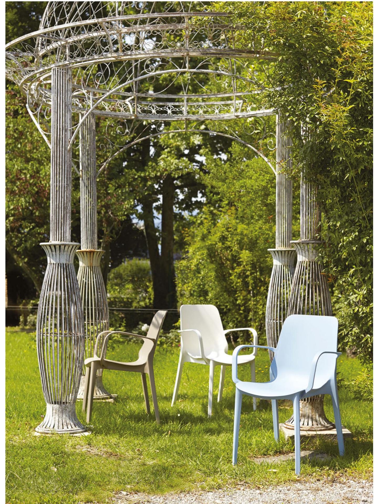
Stackable armchair Poltrona impilabile Ginevra, art. 2333

Also available in Go Green version. Disponibile anche in versione Go Green.