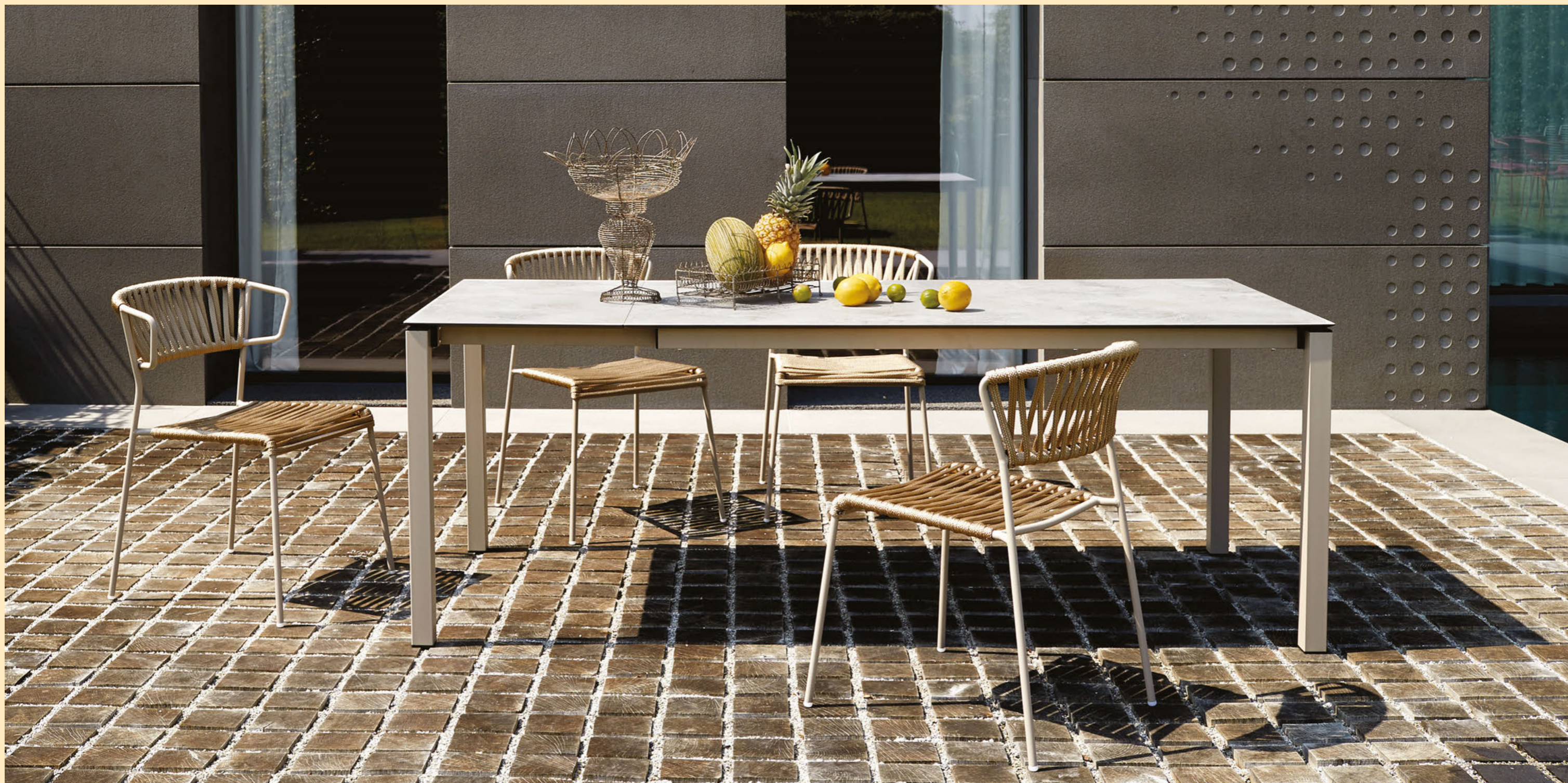
Extendable table Tavolo Pranzo Allungabile 160/210, art. 2418 h.75