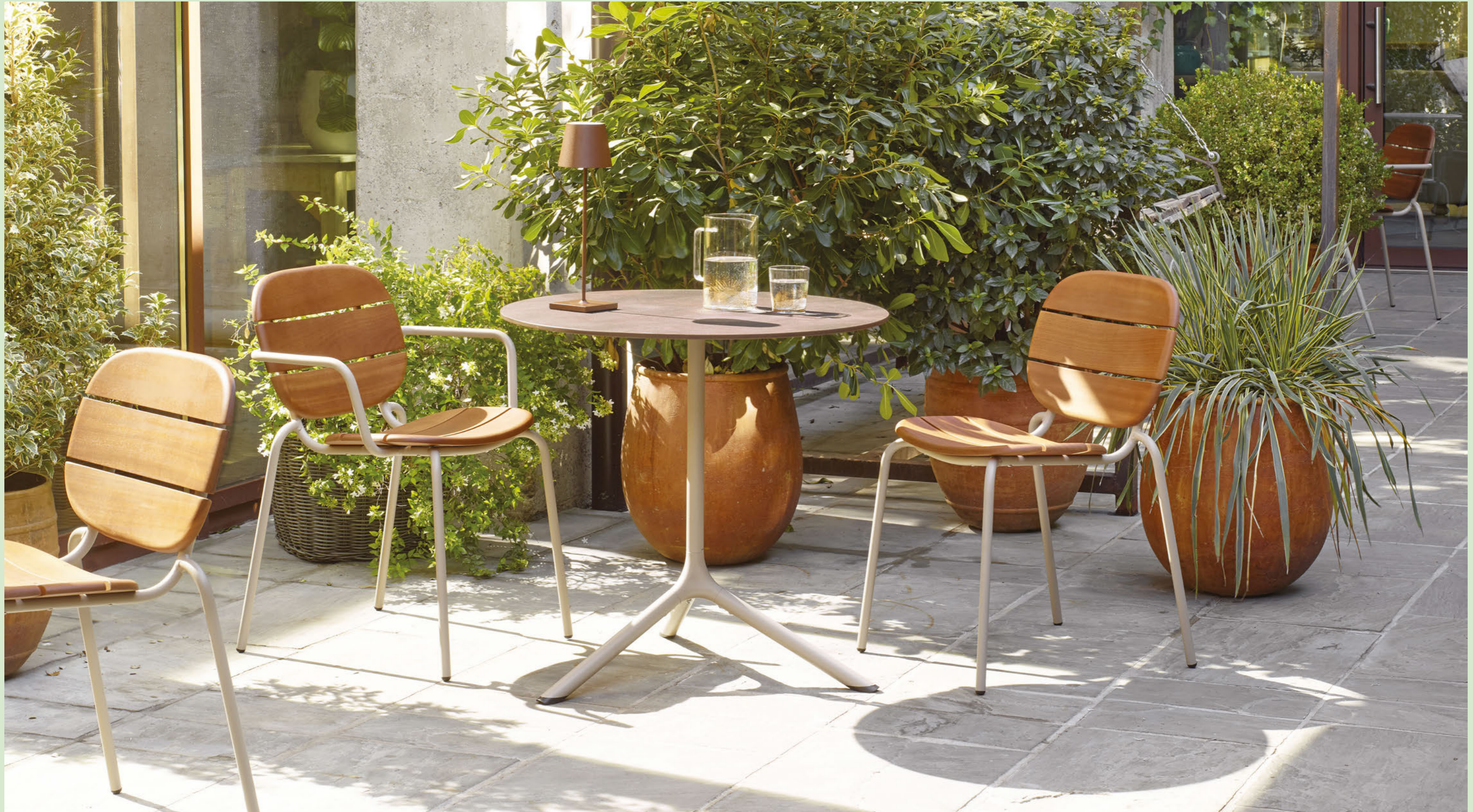
Base Tripé Maxi, art. 5006 h.73