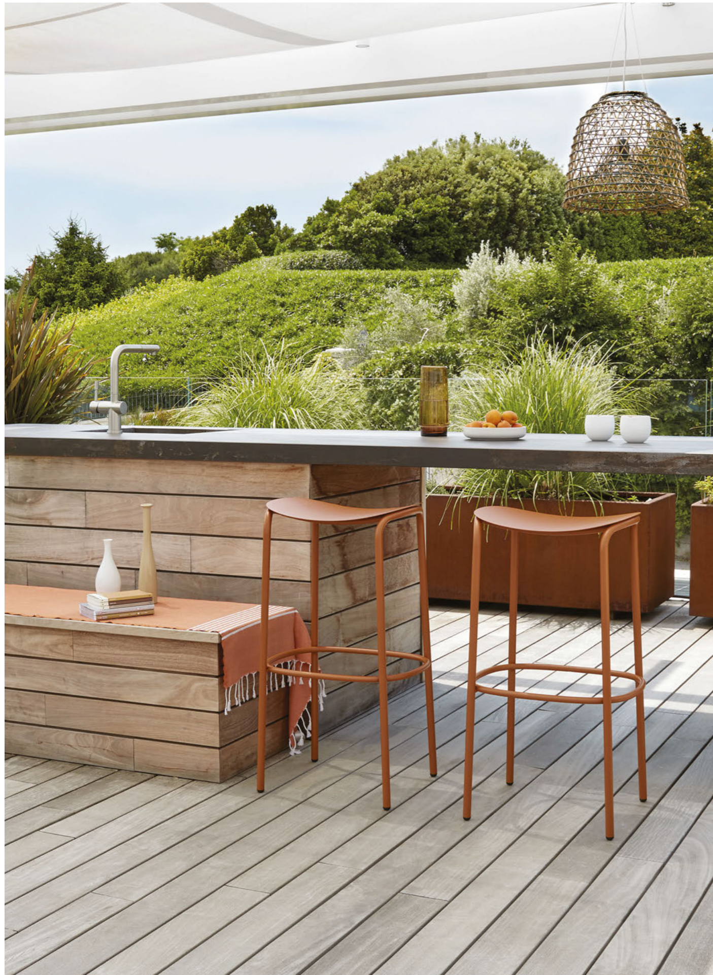
Barstool Sgabello Trick, art. 2523 h.75

Struttura in acciaio zincato e verniciato a polvere.