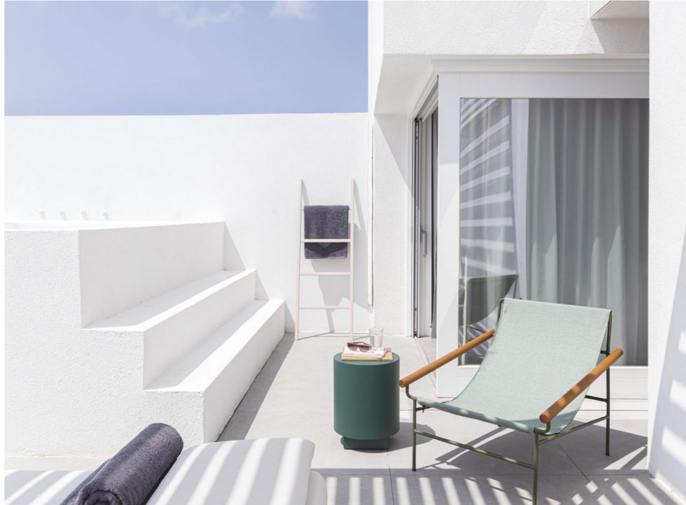
Lounge armchair Poltrona Dress_Code Smart, art. 2581