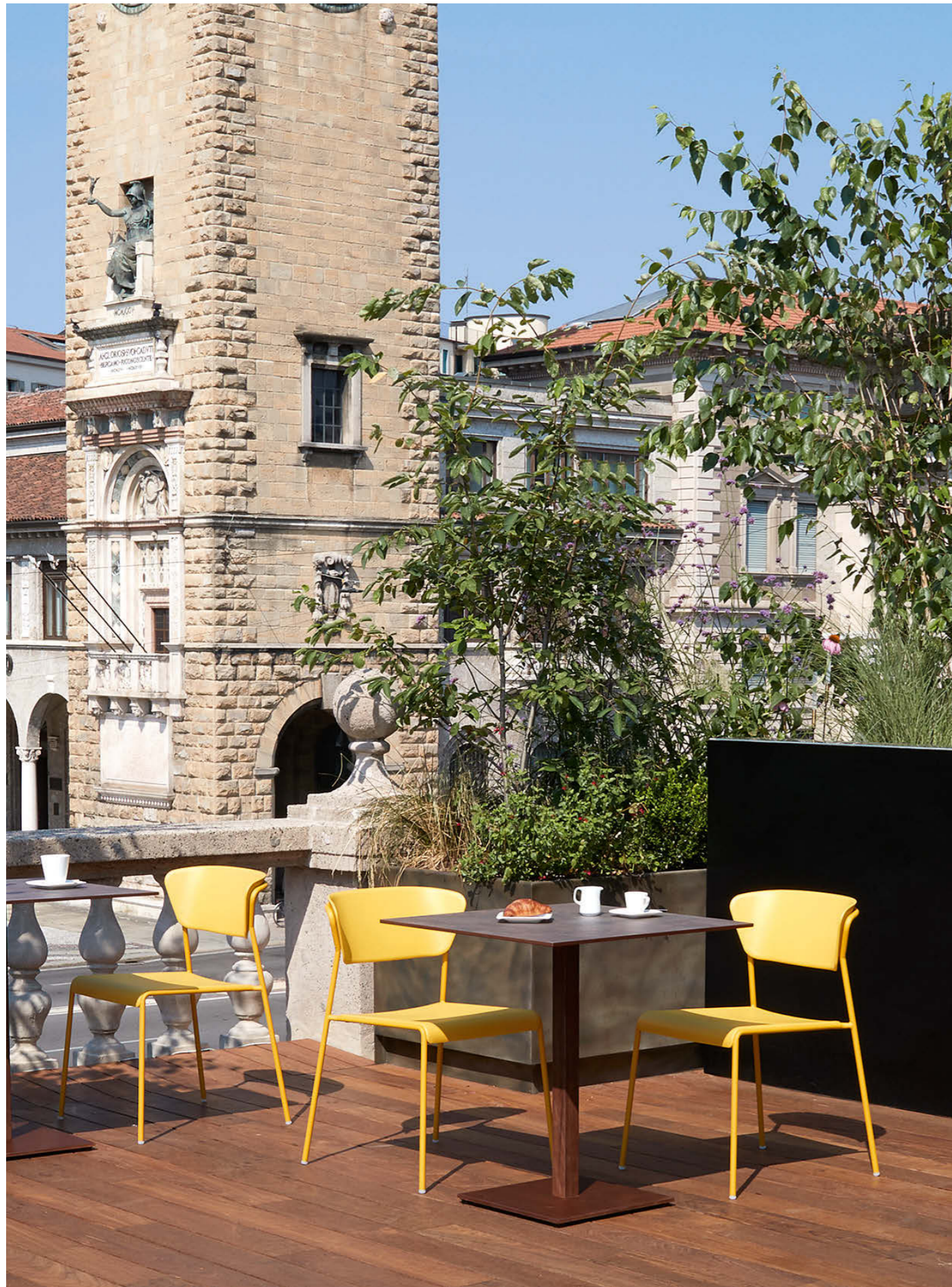
Chair Sedia Lisa Tecnopolimero, art. 2865 Base Tiffany, art. 5182

Also available in Go Green version. Disponibile anche in versione Go Green.