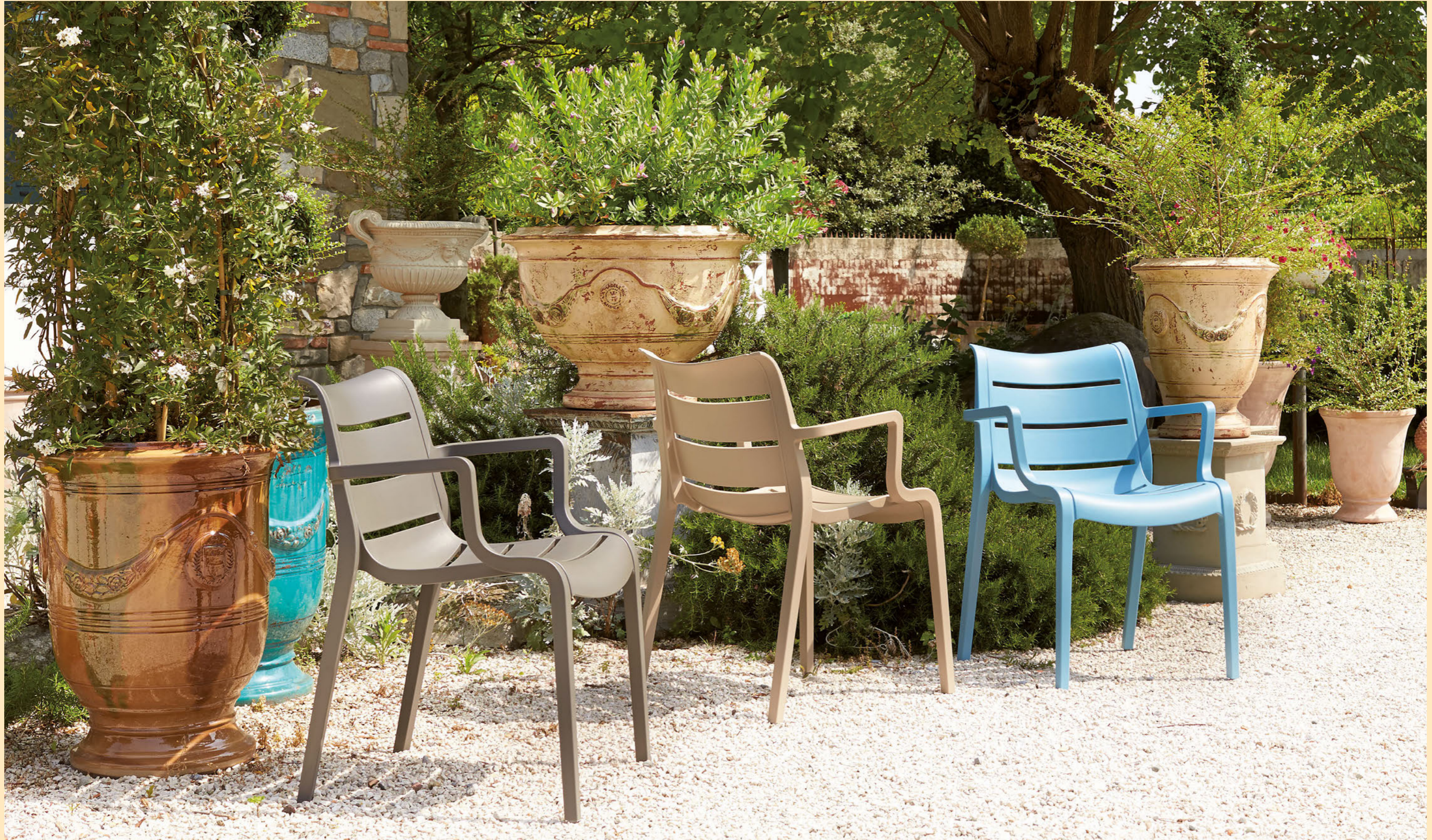
Stackable armchair Poltrona impilabile Sunset, art. 2329