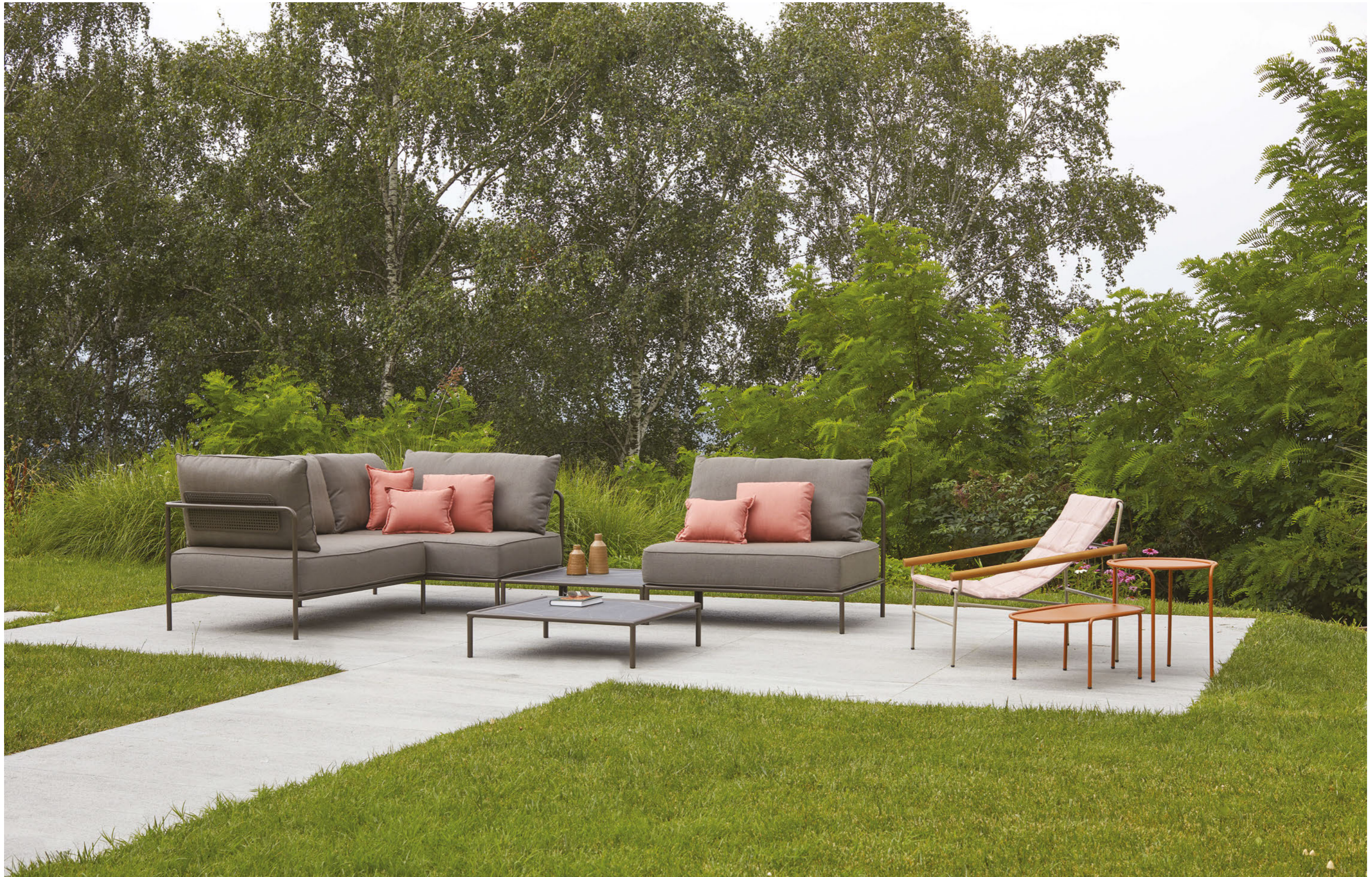
Occasional table Tavolino Flap, art. 2718 Modular system Sistema modulare Flap, art. 2887 - 2888 - 2889 - 2718 Lounge armchair Poltrona Dress_Code Glam, art. 2583