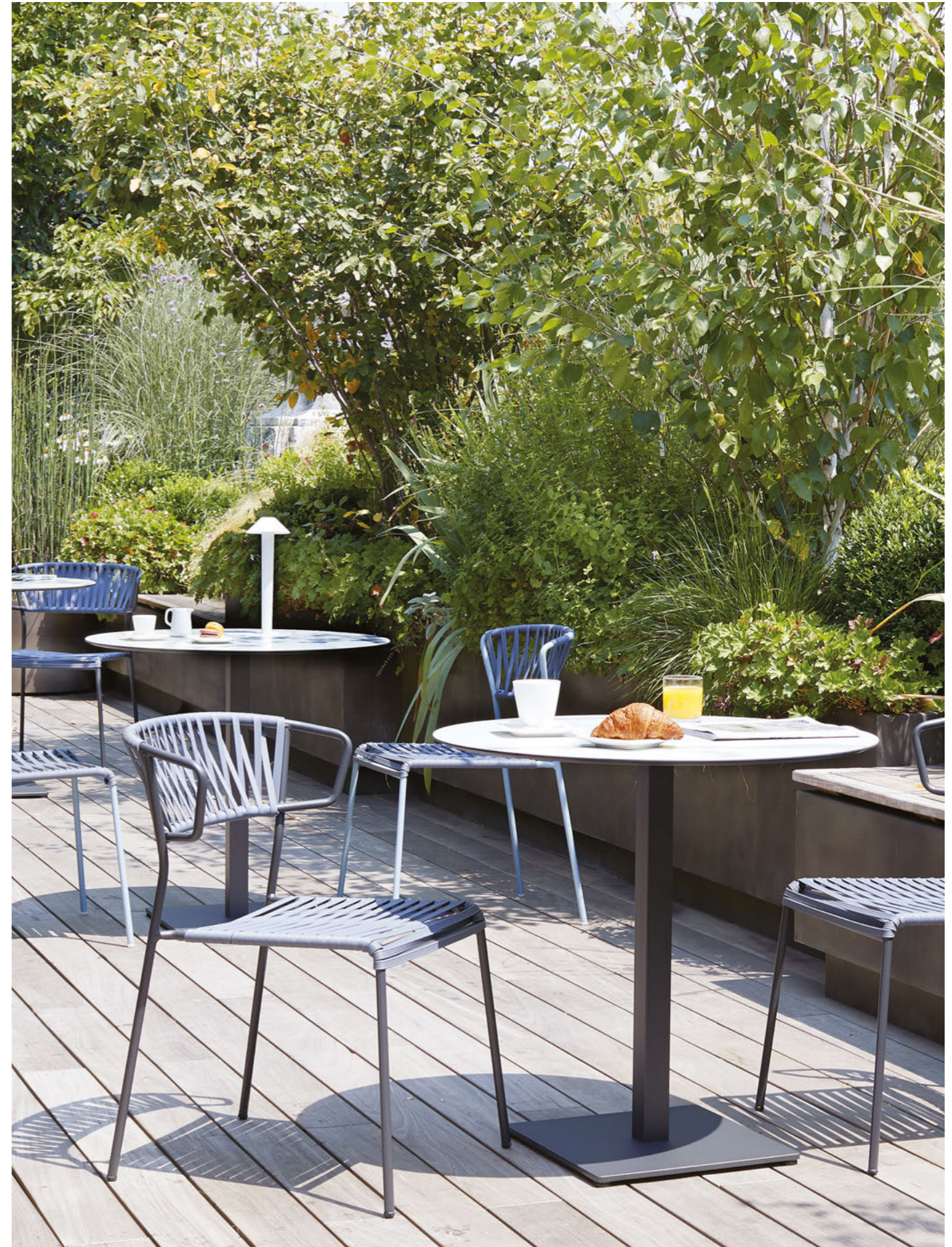
Armchair Poltrona Lisa Club, art. 2873 Chair Sedia Lisa Club, art. 2874 Base Tiffany, art. 5182

Telaio in acciaio zincato e verniciato a polvere, intreccio in estruso di PVC.