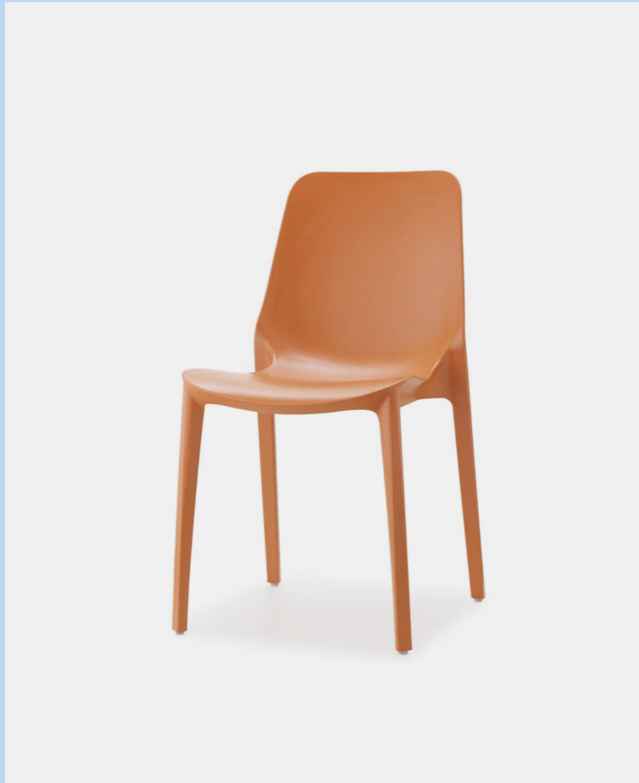
Stackable chair Sedia impilabile Ginevra, art. 2334

Also available in Go Green version. Disponibile anche in versione Go Green.