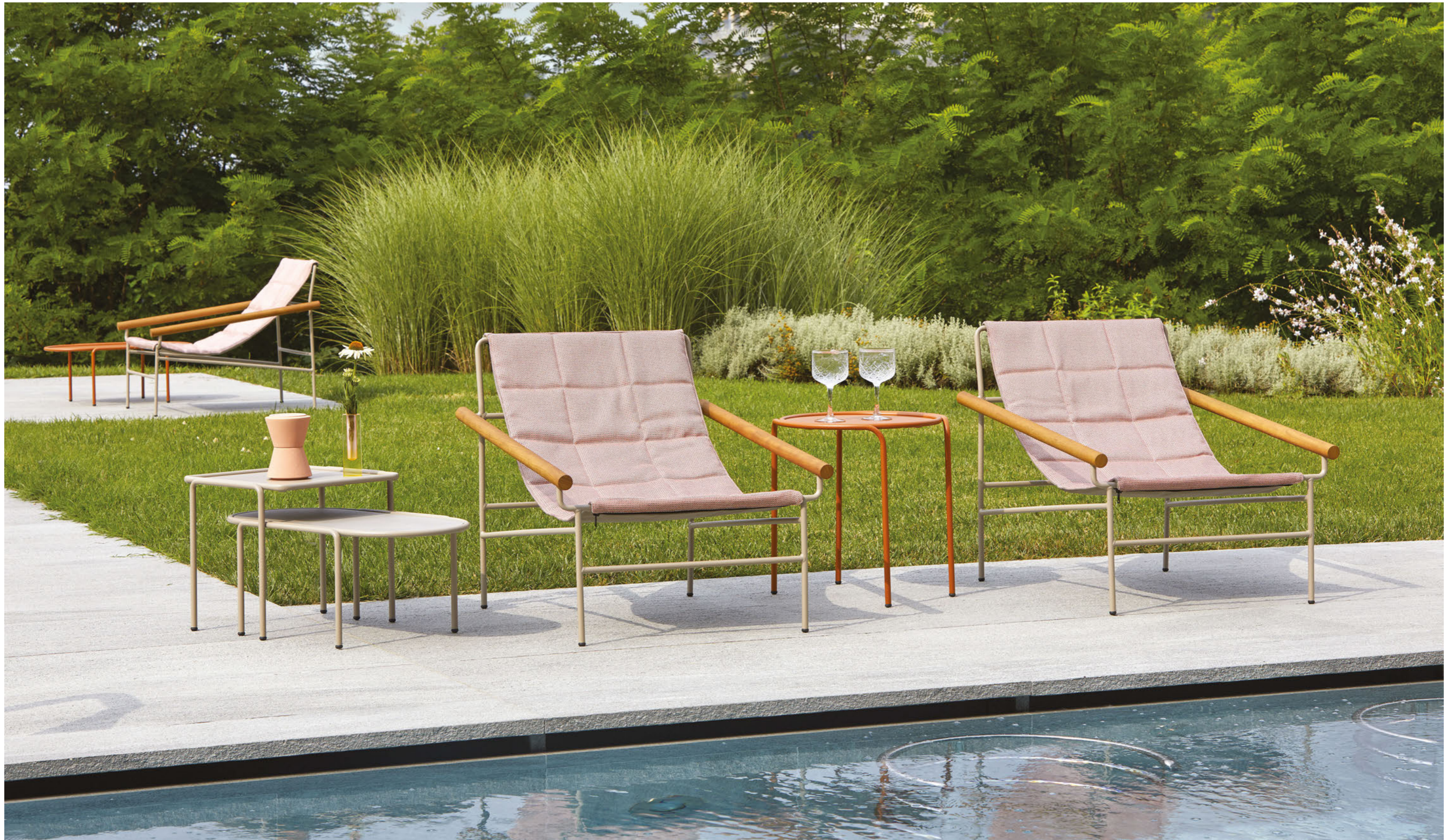
Lounge armchair Poltrona Dress_Code Glam, art. 2583 Round Coffee table rotondo Dress_Code, art. 2742 Ø 45 h.50 Oval Coffee table ovale Dress_Code, art. 2744 36x77 h.30 Square Coffee table quadrato Dress_Code, art. 2743 41x41 h.40