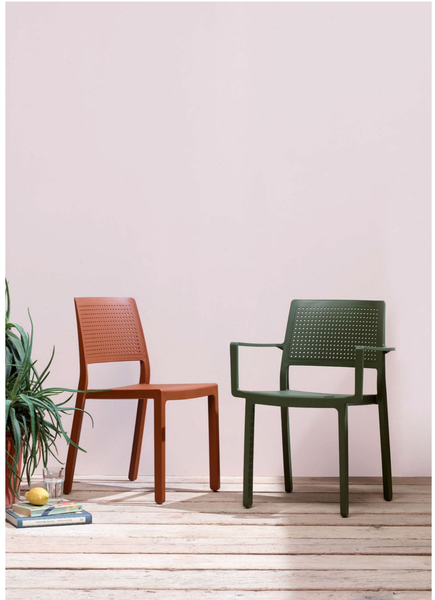
Stackable armchair Poltrona impilabile Emi, art. 2342 Stackable chair Sedia impilabile Emi, art. 2343