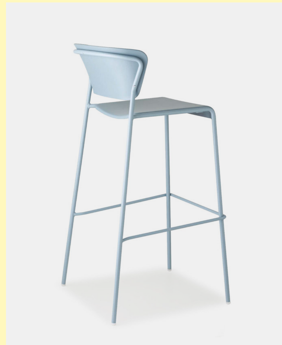
Barstool Sgabello Lisa Tecnopolimero, art. 2867 h.75