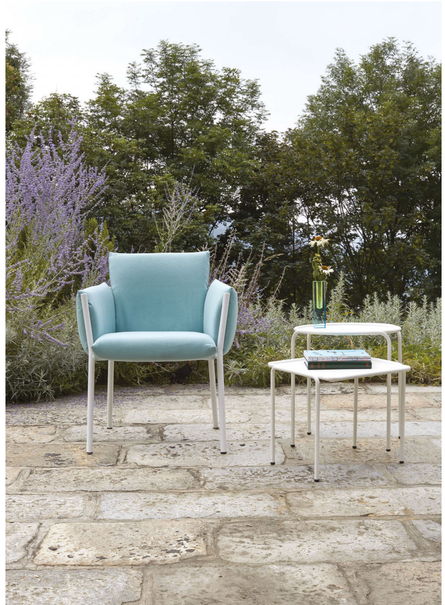
Armchair Poltrona Brezza, art. 2898 Round Coffee table rotondo Dress_Code, art. 2742 Ø 45 h.50 Square Coffee table quadrato Dress_Code, art. 2743 41x41 h.40