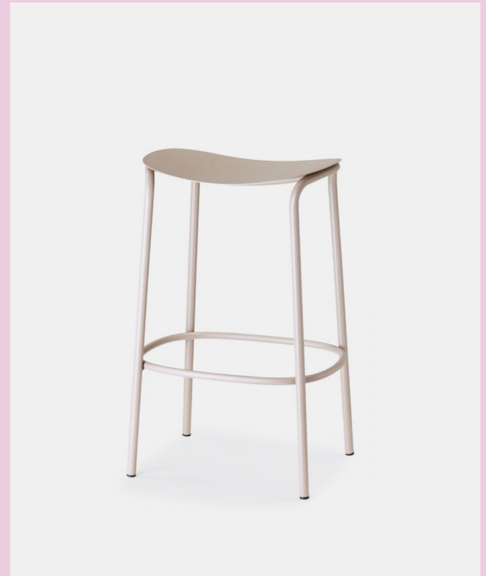
Barstool Sgabello Trick, art. 2524 h.65