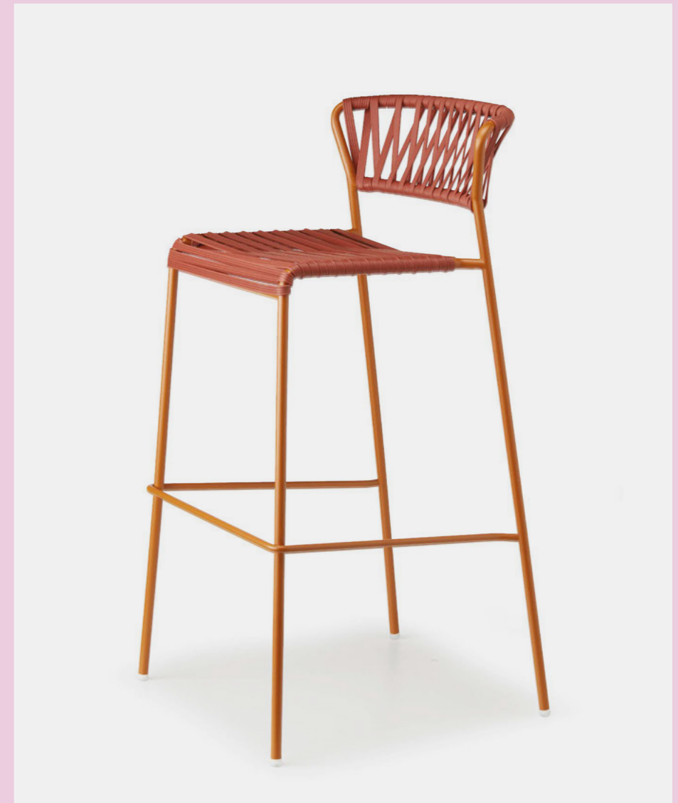
Barstool Sgabello Lisa Club, art. 2875 h.75