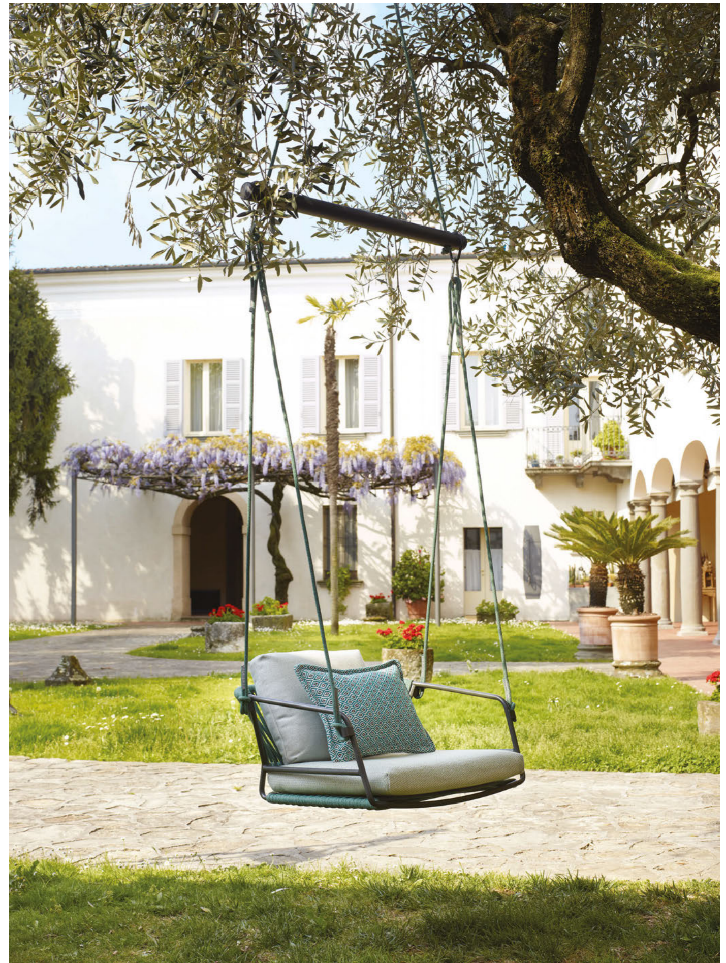
Hanging armchair Seduta Sospesa Lisa Swing, art. 2883

Telaio in acciaio zincato e verniciato a polvere, intreccio in corda nautica. Optional: cuscini tessuto Sunbrella®.